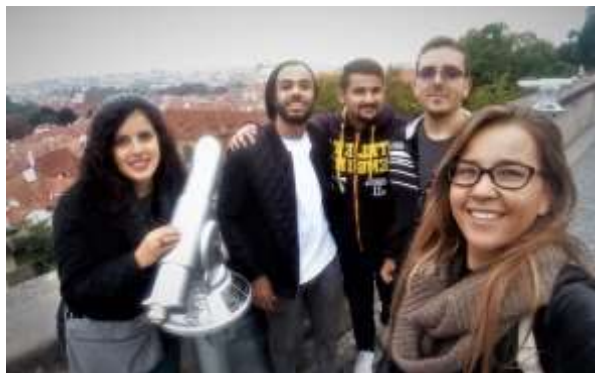
Prag u 5 ujutro