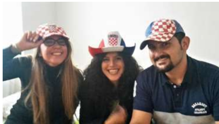
Malo nas je, al nas ima