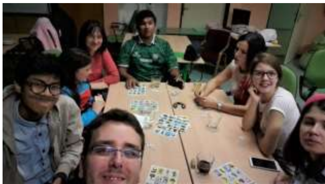
Lotteria s ravnateljicom